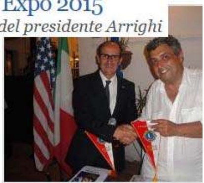
Il presidente del Lions e il Sindaco