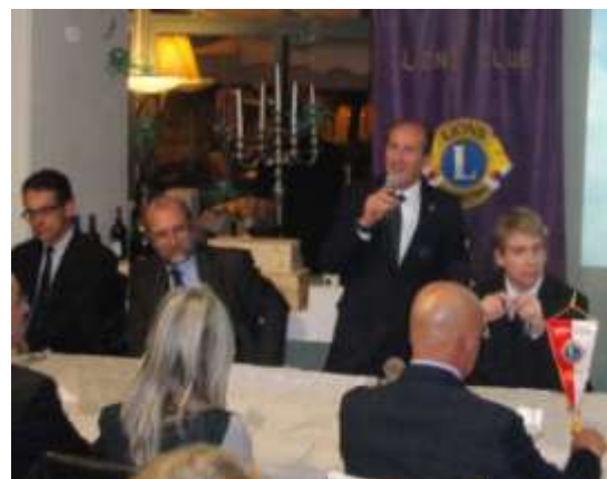
Il presidente introduce l'argomento.

dall'estero, ed è stato presentato al Festival