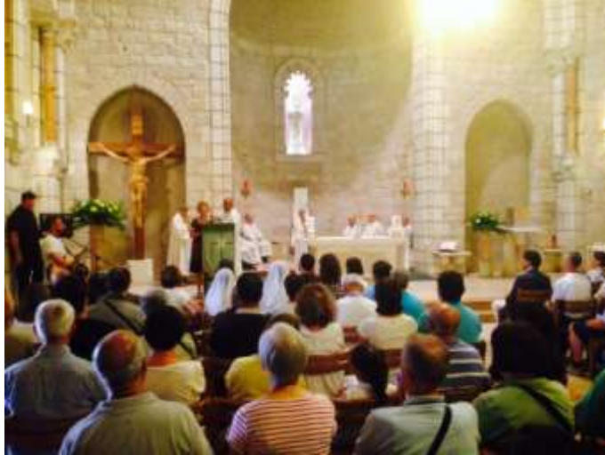
Gerusalemme: l'emozione della Seconda Lettura