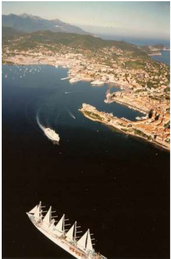
Veliero da crociera in entrata a Portoferraio

Cominciai coll'appoggiarmi al sindaco di Portoferraio e via via contattai l'on. Lucchesi,