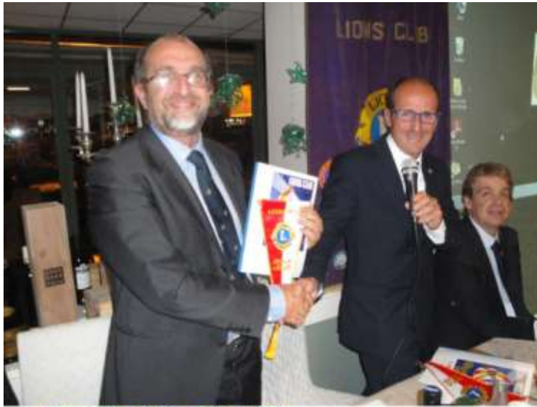
Omaggio del Club ai relatori.

di Roma dove ha vinto tre premi. La relazione del manager si è conclusa con la proiezione di una breve parte della fiction che ha riscosso l'apprezzamento e gli applausi della platea.