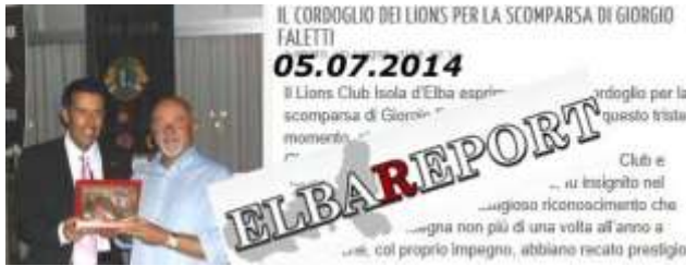
IL CORDOGGIO DEI LIONS PER LA SCOMPARSA DI GIORGIO FALETTI