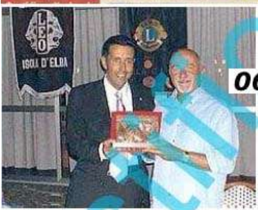
IL RICORDO Giorgio Faletti quando venne premiato nel 2006 con la targa Lions