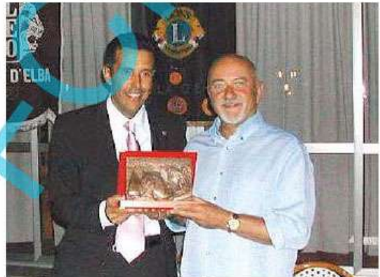
Marini premia (2006) con la targa Lions Faletti