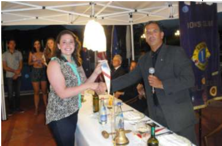
Scambi giovanili: guidoncino ai tre ragazzi ospiti.

rimonia del passaggio del distintivo, ha svolto un sintetico riassunto dell'attività portata a termine dal club sotto la sua guida, non