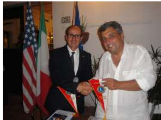
Consegna del guidoncino al sindaco di Porto Azzurro.

siano più rapidi e soddisfacenti di quelli dell'amministrazione pubblica; mentre Marini, oltre ad esprimere l'apprezzamento per l'impegno del Club nel campo della salute, ha reso noto il raggiungimento di un accordo dei comuni elbani per migliorare la situazione sanitaria dell'Isola, simbolo anche di una buona accoglienza per gli ospiti della stagione turistica.